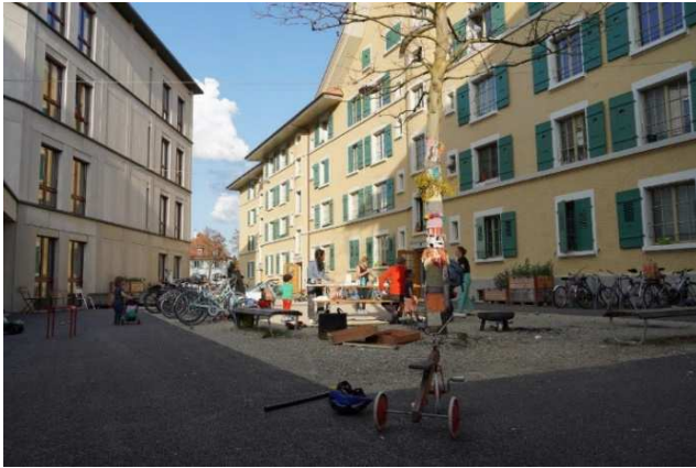
Innenhof Wasenstrasse Biel/Bienne